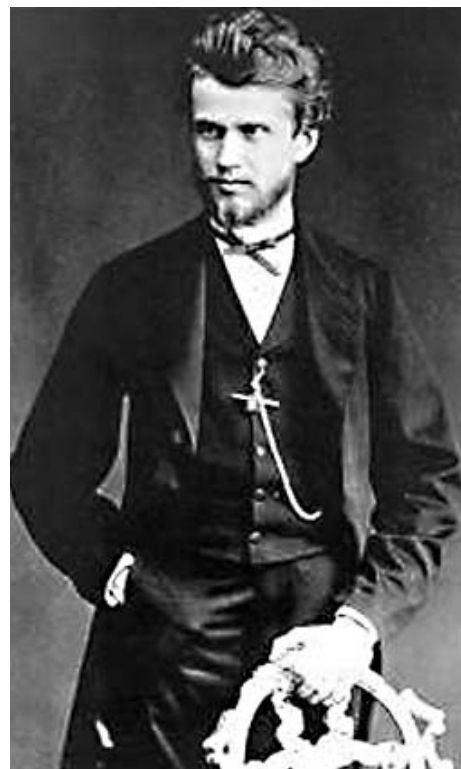
Zdroj: Josef Schánilec. Za slávou. Čtení o českých hudebnících v Rusku zvláště od druhé poloviny XVIII. do počátku XX. století. 1. vyd. Praha: Svět sovětů, 1961

Bohužel zdoluhavá nemoc nedovolila Marešovi zdokonalit loveckou hudbu podle jeho představ, to se podařilo až jeho nástupcům. V červenci 1789 Mareš byl raněn mrtvicí a odešel do penze, jejíž výše se rovnala jeho aktivnímu platu. Už toto svědčí, jak byl ceněn český hudebník. Zemřel Mareš v Petrohradě dne 30. května 1794. Orchestry rohové hudby, přizpůsobené Marešem ke koncertování, byly rozšířené nejen mezi feudálními velmoži, ale i boháči tehdejšího Ruska a byly vhodným atributem velkých slavností. V roce 1787 v ukrajinském Chersonu při